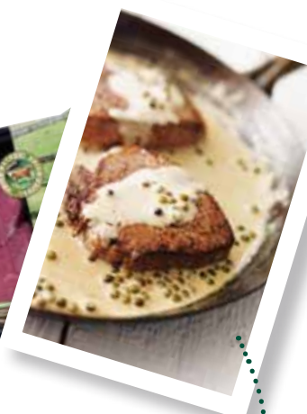
Rumpsteak, zie recept op pagina 75

Waarom we ons Ierse rundvlees Superieur noemen? Omdat onze Herefords het mooiste leven leiden dat een rund zich maar voor kan stellen. Toen het woord 'biologisch' nog niet eens bestond hielden ze op deze manier al koeien in Ierland. En zo doen ze het nog steeds. Waar komt het Ierse rundvlees van Super de Boer vandaan? Hier dus. Een Superieure ontmoeting.